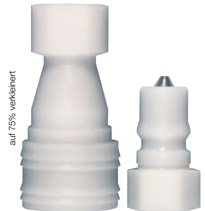
auf 75% verkleinert

Folgende andere Ausführungen finden Sie im aktuellen Gesamtkatalog auf Seite: